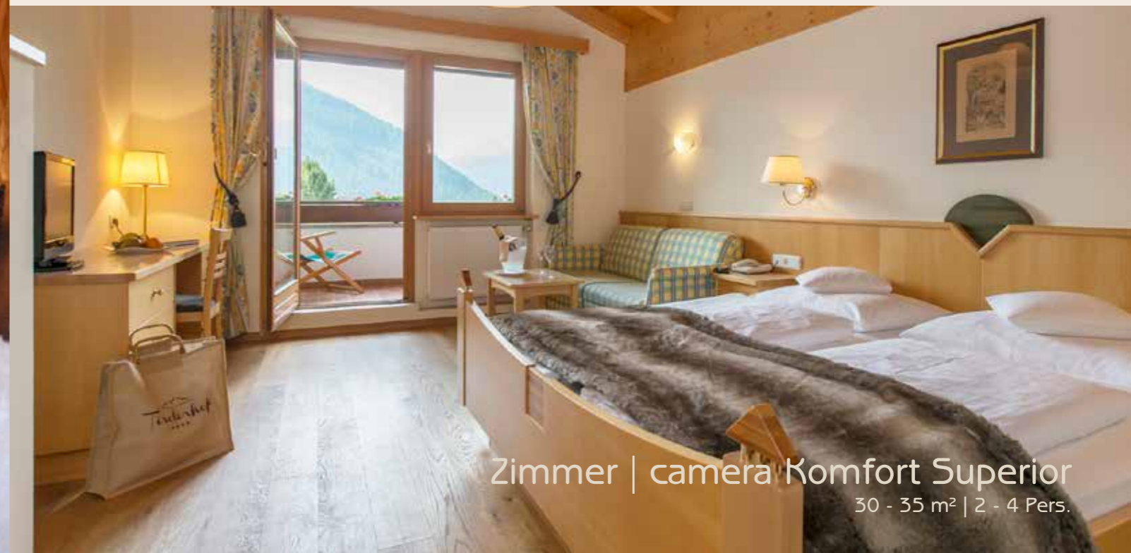
Zimmer | camera Komfort Superior 30 - 35 m 2 | 2 - 4 Pers.