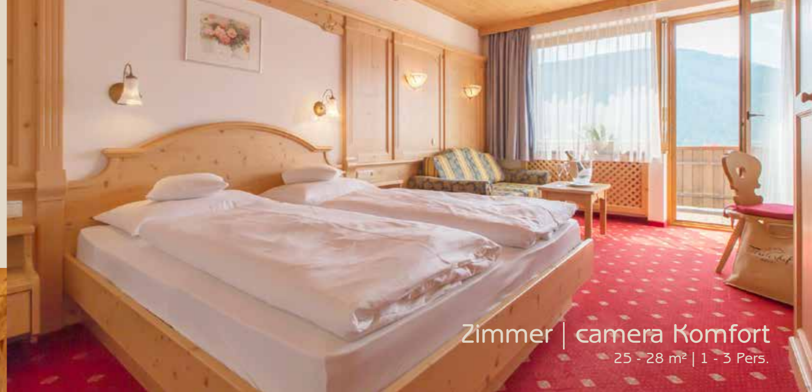
Zimmer | camera Komfort 25 - 28 m 2 | 1 - 3 Pers.